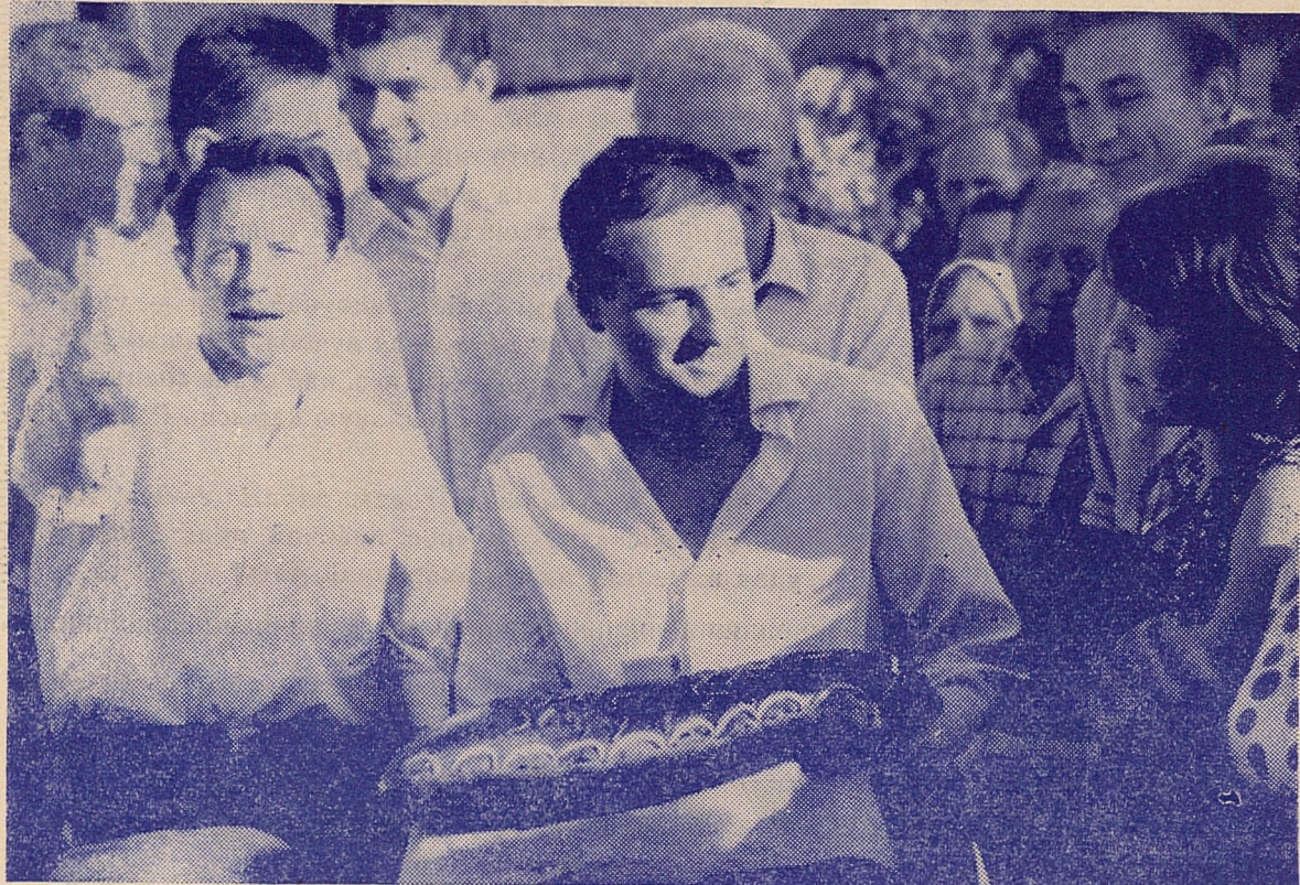
Па старадаўняму народнаму звычаю студэнты нашага ўніверсітэта і працаўнікі саўгаса «Чырвоная зорка» Клецкага р-на сустрэлі групу чэхаславацкіх студэнтаў «Хлебам-соллю».

Рэйдавая брыгада газеты «Беларускі ўніверсітэт».